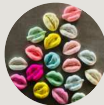
kleine decoratieve elementen