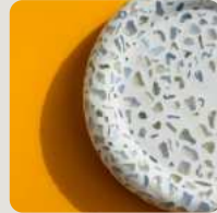
Incorporatie van zand of schelpen