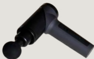
Massagepistool of trilplaat (vergemakkelijkt het verwijderen van luchtballen uit grotere JESIN-gietstukken)