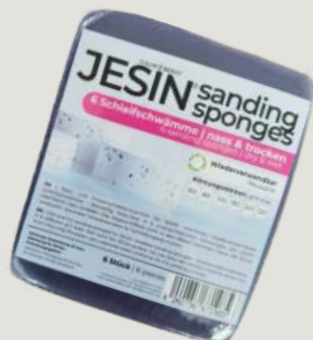
Natte en droge schuursponzen (voor het schuren van terrazzo of uitstekende randen)