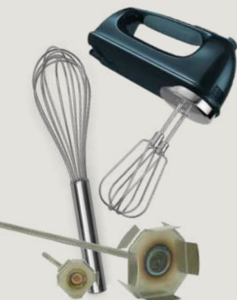
Handmixer/garde of garde met hoge afschuiving (maakt het mengen gemakkelijker bij grotere hoeveelheden JESIN)