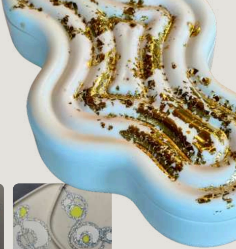
Inbouw van slagmetaal